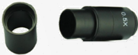
Anel 30mm 0.5x Adaptador

Remova todas as partes da caixa. Em seguida, remova a tampa de proteção da câmera.